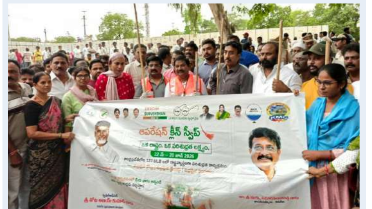
కనిగిరి స్వర్ణ సాగరం మే 23

పరిసరాలు పరిశుభ్రముగా ఉంచుకోవాలి -మంత్రి స్వామి, ఎమ్మెల్యే ఉగ్ర