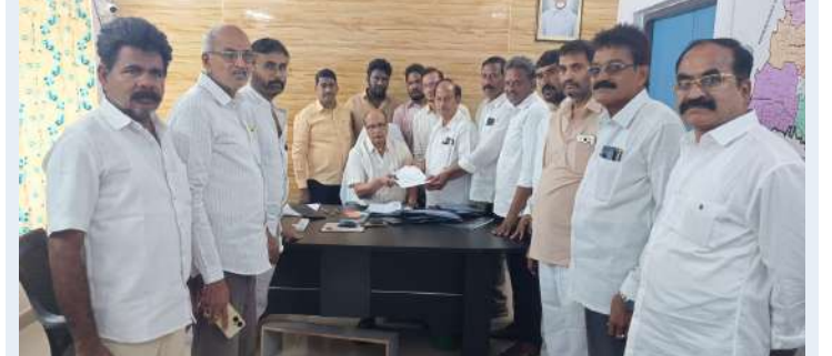
కనిగిరి స్వర్ణ సాగరం మే 23