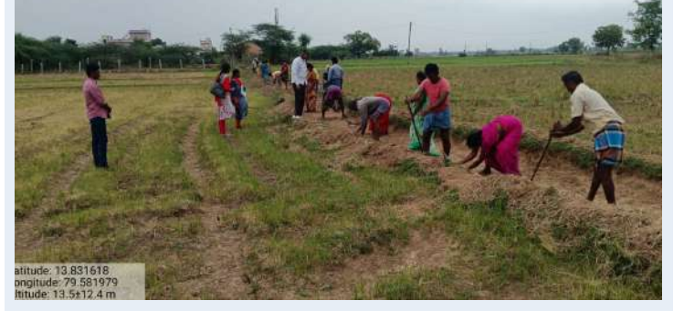
స్వర్ణ సాగరం ఏప్రిల్ 23

జలధార - జలహారతి పనుల తనిఖీ చేసిన డ్యామా పీడి