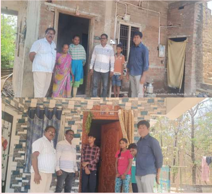
స్వర్ణ సాగరం బుచ్చినాయుడు కండ్రిగ