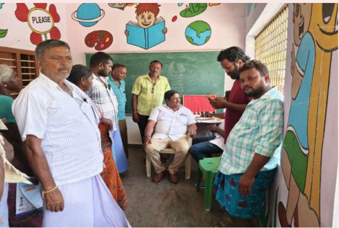
స్వర్ణ సాగరం ఏర్పేడు :