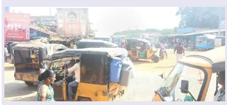
స్వర్ణ సాగరం బుచ్చినాయుడు కండక్టర్

మండల కేంద్రంలోని బస్టాండ్ ఆవరణలో రోడ్డుపై విచ్చలవిడిగా ఆటోలు ఉండడంతో బస్సులు ఎక్కి ప్రయాణించే ప్రయాణికులు ఇబ్బందులు పడుతున్నట్లు వారు తెలిపారు. అసలే మందుతున్న ఎండలు కారణంగా ఎక్కడ నిలబడుకోవాలన్నా ఆటోలు ఉండడం వలన ఇబ్బందిగా ఉన్నట్లు వారు తెలిపారు. ఆటో డ్రైవర్ లు ఆటోలను సీరియల్ ప్రకారం కాకుండా వారికి సమీపంగా వ్యవహరిస్తున్నట్లు ప్రయాణికులు తెలిపారు. ప్రయాణం చేయాలన్నా చాలా కష్టంగా ఉన్నట్లు వారన్నారు. సంబంధిత అధికారులు స్పందించి ఆటోలను క్రమబద్ధంగా పెట్టుకునే విధంగా సహకరించాలని వారు కోరారు.