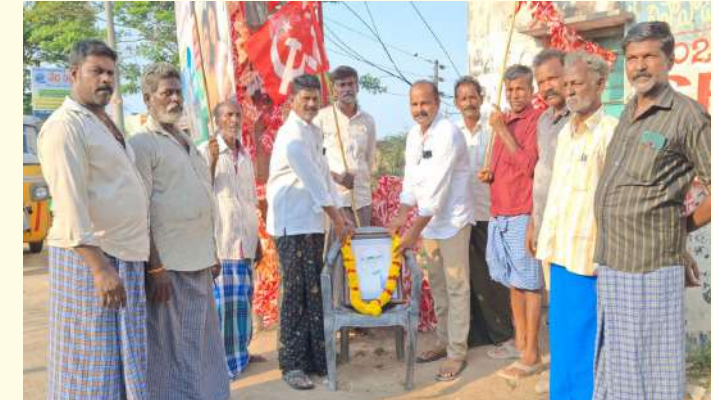
తోపల్లి గూడూరు స్వర్ణ సాగరం మే 19