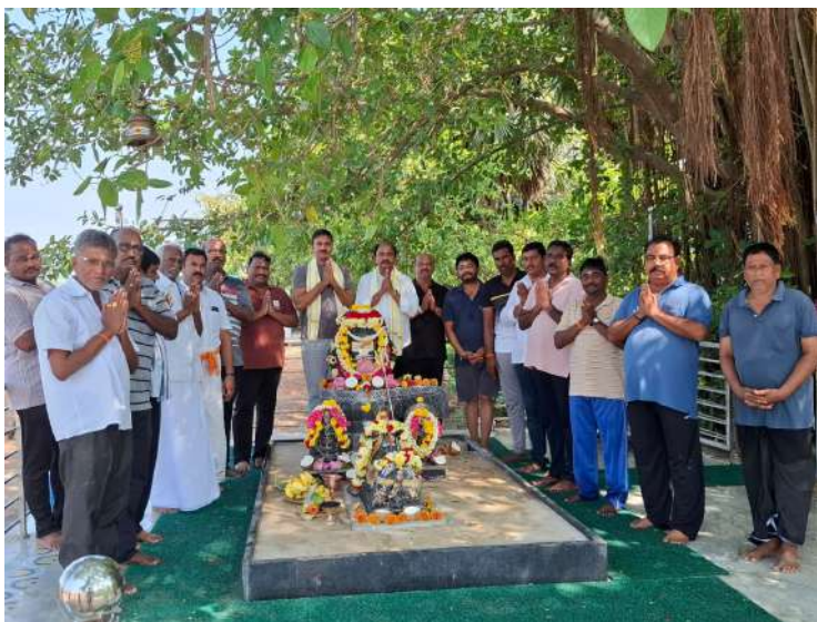
భక్తులతో ఆలయ ప్రాంగణం శివనామస్మరణతో మారుమోగింది.