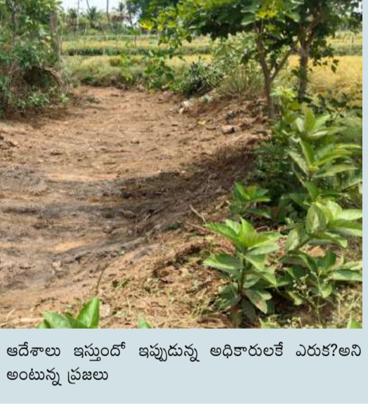
అనుకోవడం అత్యాచారం అంటున్న ప్రజలు

సలు ఆ పని జరుగుతున్నట్లు తనకు తెలియదని, నిధులను మంజూరు ఆపివేస్తానని నింపాదిగా తెలిపారు. కృష్ణ జిల్లా లో నిండిపోయిన చెరువుల్లో చేపల కుంటలు తవ్విన అధికారులకు జెసిబి యంత్రాలతో పనులు పూర్తి చేసిన వాటికి అనుమతులు తెచ్చుకోవడం కష్టమంటారా? ఎవరి ప్రయోజనం లేకుండా ఇలా పనులు చేపట్టడం సాధ్యమేనా? పన్ను నష్టకు గురైనప్పటికీ అధికారి యంత్రాంగం తమ బుద్ధిని ఇకనైనా మారుతుంది అని అనుకోవడం అత్యాచారం అంటున్న ప్రజలు