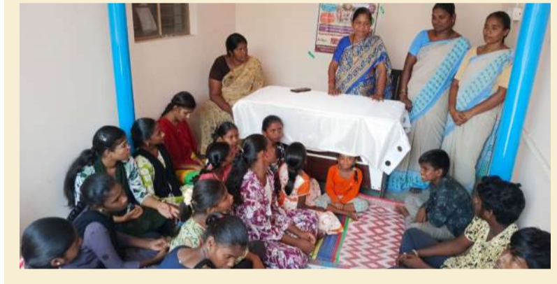
సమ్మర్ క్యాంపెండ్లో సందర్భంగా జిసిడిఎస్ సూపర్వైజర్ అలితాబ