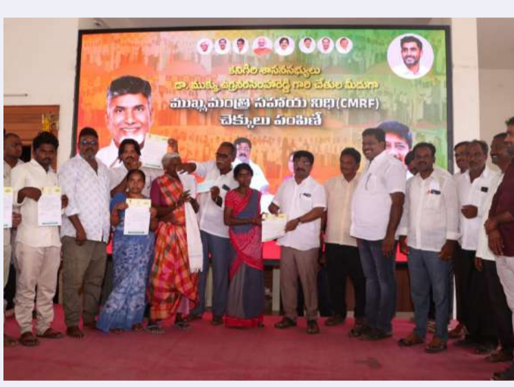
కనిగిరి స్వర్ణ సాగరం మే 05