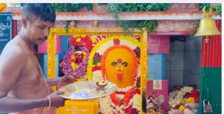
స్వర్ణ సాగరం (నాయుడుపేట) మే 4.