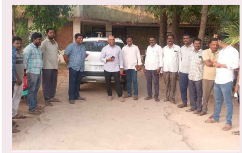
స్వర్ణ సాగరం (నాయుడుపేట) మే 4.