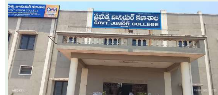
మనుబోలు, స్వర్ణ సాగరం:

- ప్రెసిడెంట్ ఆర్ లావణ్య ప్రైవేట్ కాలేజీని మరిచిన ప్రభుత్వ జూనియర్ కాలేజీ