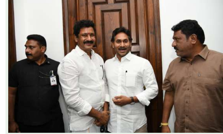
జిల్లాకూ స్వర్ణసాగరం ఏప్రిల్ 15.

మాజీ ముఖ్యమంత్రి, వైయస్సార్ కాంగ్రెస్ పార్టీ అధినేత వైయస్ జగన్మోహన్ రెడ్డిని మంగళవారం ఆ పార్టీ రైతు విభాగం రాష్ట్ర అధికార ప్రతినిధి చిందేపల్లి మధుసూదన్ రెడ్డి తాడేపల్లి పార్టీ కార్యాలయం నందు మర్యాదపూర్వకంగా కలిశారు. ఈ సందర్భంగా చిందేపల్లి మాట్లాడుతూ రాష్ట్రంలో కూటమి ప్రభుత్వం అలావకాలను ప్రజల్లోకి తీసుకెళ్లి విధంగా తమ వంతు కృషి చేస్తున్నట్లు వెల్లడించారు. చంద్రబాబు సర్కారు రాష్ట్రాన్ని అప్పుల ఊటలో నెట్టి రాజకీయ జిమ్మిక్కులు చేస్తున్నట్లు ఆరోపించారు. రాష్ట్రంలోని కూటమి నేతలంతా మట్టి, గ్రావెల్, ఇసుక తదితర ప్రకృతి సంపదను దోచుకోవడమే కాకుండా ప్రభుత్వ భూములు, ప్రభుత్వ ఆస్తులను కట్టా చేస్తూ రాష్ట్ర అభివృద్ధిని పట్టించుకోకుండా వ్యవహరిస్తున్నట్లు విమర్శించారు. వచ్చే ఎన్నికల్లో రాష్ట్ర ప్రజలంతా జగన్మోహన్ మనస్ఫూర్తిగా ఆశీర్వాదించడం కోసం ఎదురుచూస్తున్నట్లు వెల్లడించారు.