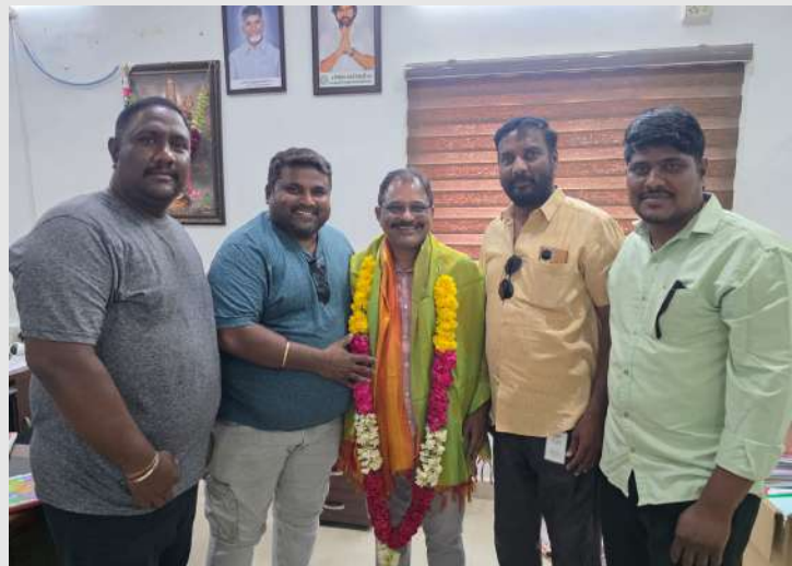
రేణిగుంట స్వర్ణ సాగరం ఏప్రిల్ 15

లెజిండ్ తాసిల్దార్ శ్యాంప్రసాద్ కు ఘన సన్మానం