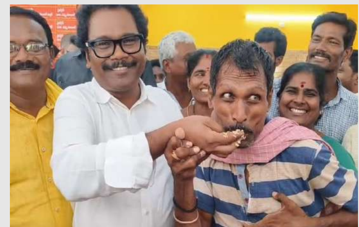
గంగాధర నెల్లూరు: (శ్రీరంగరాజపురం): స్వర్ణ సాగరం: ఏప్రిల్ 15 :