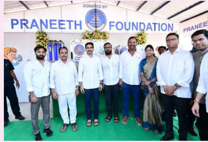
స్వర్ణ సాగరం (నాయుడుపేట) ఏప్రిల్ 15.

-సూక్ష్మారుపేటలో రూ.2.70 కోట్లతో ఎన్టీఆర్ క్రీడా వికాస కేంద్రం ఏర్పాటు..!