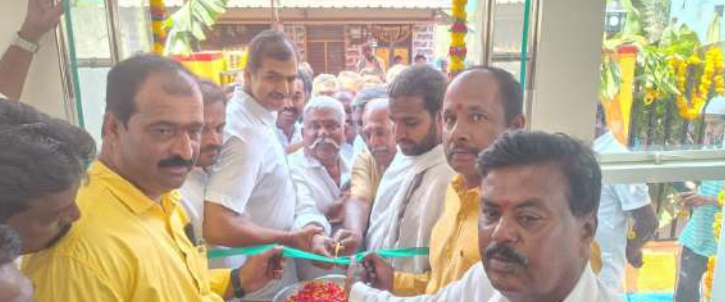
స్వర్ణ సాగరం రామకృష్ణఫిలవరి 15

నూతనంగా నిర్మించిన అన్న క్యాంపేన్ రామకృష్ణం కో కుటుంబసేవల ప్రారంభించారు. ప్రతి పేదవాడికి కేవలం రూ.5కే నాణ్యమైన, పోషకాహార భోజనం అందించాలనే లక్ష్యంతో ఈ అన్న క్యాంపేన్ ఏర్పాటు చేసినట్లు నేతలు తెలిపారు. సమాజంలోని ఆర్థికంగా వెనుకబడిన వర్గాల వారికి కడుపునొప్పి భోజనం అందించాలనే ఉద్దేశంతో ప్రజలకు సులభంగా అందుబాటులో ఉండే ప్రదేశంలో ఈ సదుపాయాన్ని కల్పించినట్లు పేర్కొన్నారు. అన్న క్యాంపేన్ ప్రారంభం అనంతరం నేతలు పేద ప్రజలు భోజనం చేశారు. వారి సమస్యలను తెలుసుకున్నారు. ప్రజల సంక్షేమమే తమ ముఖ్య లక్ష్యమని, భవిష్యత్తులో కూడా ఇలాంటి సేవా కార్యక్రమాలను మరింత విస్తరించనున్నట్లు తెలిపారు. ఈ కార్యక్రమంలో స్థానిక ప్రజాప్రతినిధులు, కూటమి పార్టీ నాయకులు, కార్యకర్తలు మరియు పెద్ద సంఖ్యలో ప్రజలు పాల్గొన్నారు.