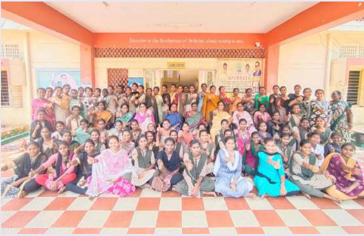
కోటపల్లి గూడూరు స్వర్ణ సాగరం ఏప్రిల్ 15

మండలంలోని కోడూరు డాక్టర్ బానాసావాజ్ అంబేద్కర్ బాలికల గురుకుల కళాశాలలో ఇంటర్ ఫలితాలు 100% సాధించడం పట్ల కళాశాల ప్రిన్సిపాల్ ఎస్ట్రమ్ అధ్యాపక సిబ్బందికి కళాశాలలో విద్యను అభ్యసించుచున్న బాలికల తల్లిదండ్రుల ప్రత్యేక కృతజ్ఞతలు తెలిపారు.