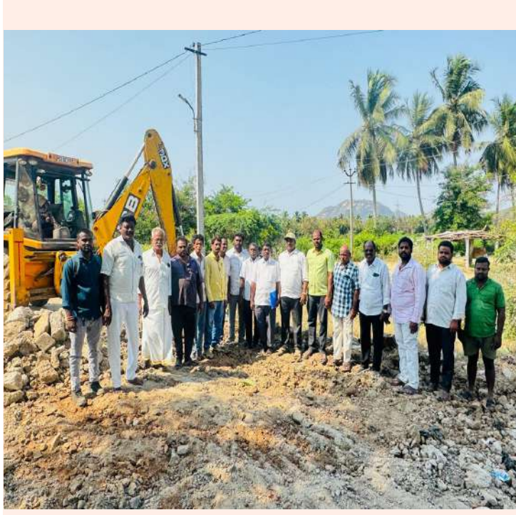
- పంచాయతీ ప్రజల హర్షం.....