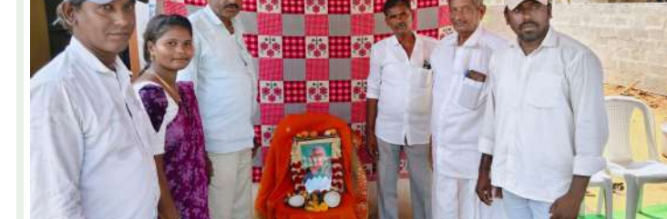
జిల్లాకూ స్వర్ణసాగరం ఏప్రిల్ 15.