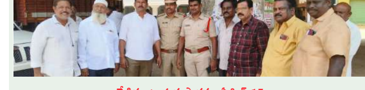
రేణిగుంట స్వర్ణ సాగరం ఏప్రిల్ 15

బాలికల ఉన్నత పాఠశాల ఎదురుగా ఫైట్ వర్ బ్రిడ్జి కింద