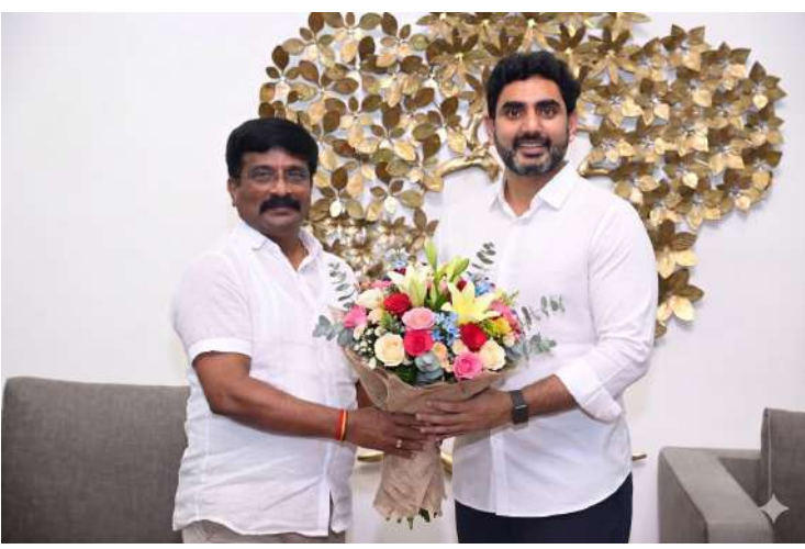
కనిగిరి స్వర్ణ సాగరం ఏప్రిల్ 15