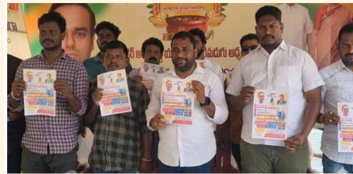
కోవూరు, స్వర్ణ సాగరం, ఏప్రిల్ 4: